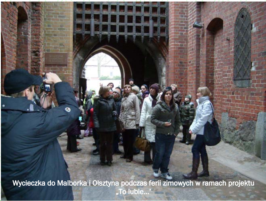
Wycieczka do Malborka i Olsztyna podczas ferii zimowych w ramach projektu „To lubie...”